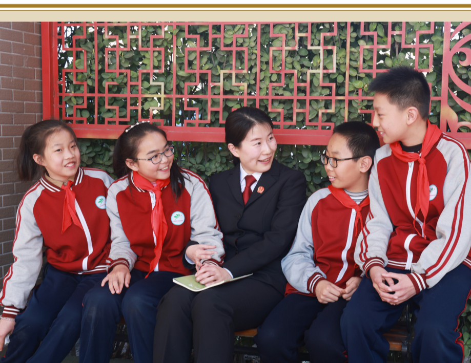
《法润幼苗 守护未来》 王茂楨 昌邑县人民法院