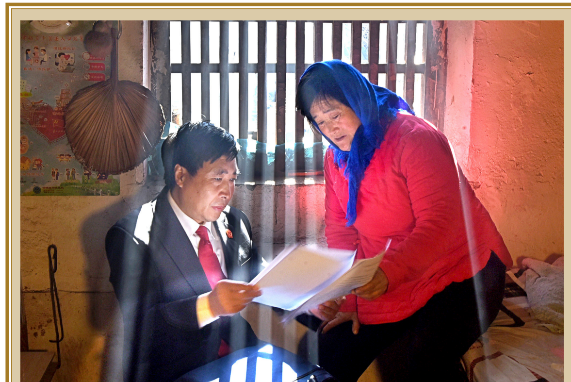
▲二等奖：《大山深处的“流动法庭”》作者：赵东山 李楠（沂源县人民法院） ▼二等奖：《银河下的流动法庭》作者：刘昭辰（淄博市临淄区人民法院） (全省法院“弘扬法治文化 共庆祖国华诞”书画摄影比赛优秀作品选登)

唯愿不辜负，但求莫叹息。在未来的日子里，我将继续以认真的态度对待工作和生活，努力成为一个更好的自己，为父母、为家庭、为社会贡献自己的力量。